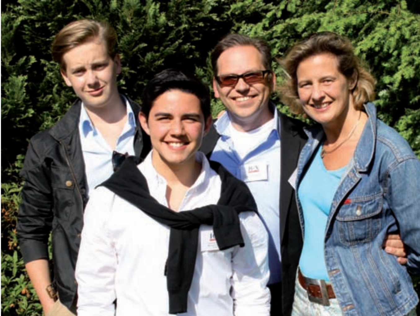
Gastfamilie mit ihrem Austauschschüler