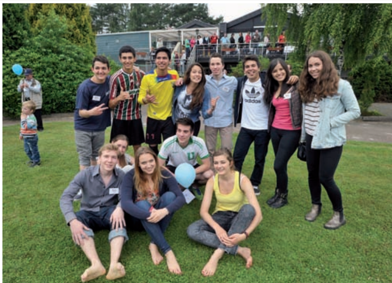
Treffen der Austauschschüler auf dem ICX-Sommerfest

Für alle Schüler besteht Kranken-, Unfall- und Haftpflichtversicherungsschutz, der durch uns gewährleistet wird.