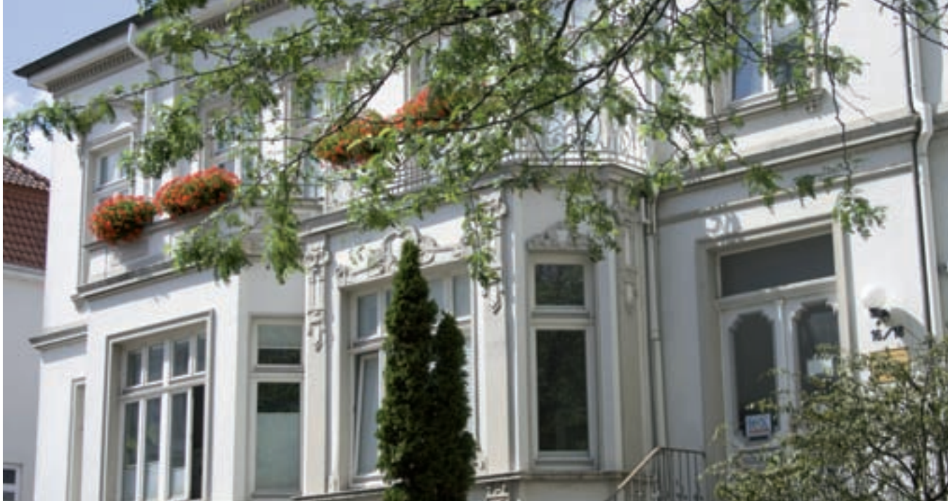
ICX-Bürogebäude in Oldenburg