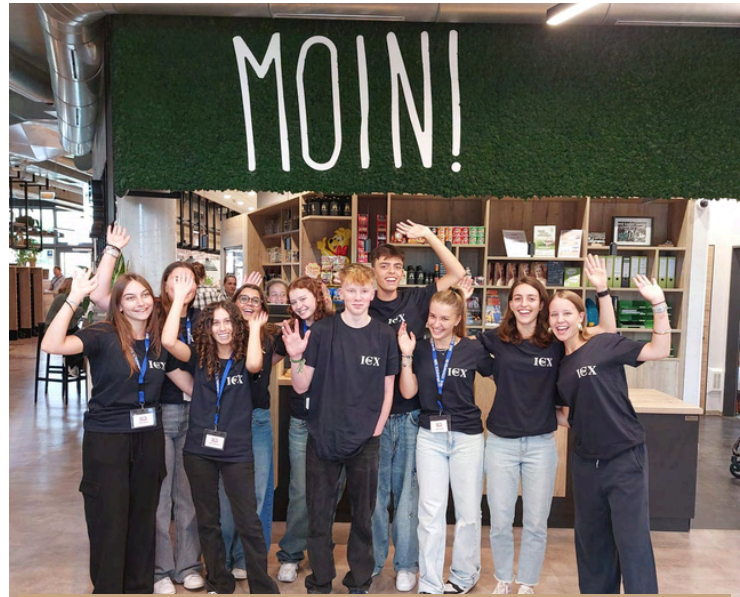
In Deutschland hatte ich ein zweitägiges Seminar in Oldenburg, bei dem ich meine erste Freundschaften schließen konnte mit anderen Austauschschülern.

Am Tag der Abreise war ich sehr nervös, aber auch sehr glücklich, dass einer meiner großen Träume endlich in Erfüllung gehen würde.