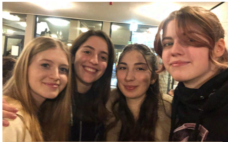
Die Pause mit meine Freunden war aber immer noch der beste Teil!

Mit der Zeit wurde es immer besser: Am Anfang ging ich nicht so gerne zur Schule, aber als ich mich eingelebt hatte, fing ich an, gerne hinzugehen. Ich habe sogar einige Klausuren geschrieben! Die Lehrer und Lehrerinnen sind immer sehr nett und hilfsbereit gewesen.