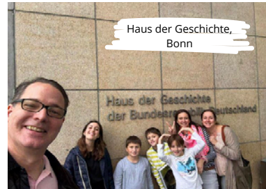
Haus der Geschichte, Bonn