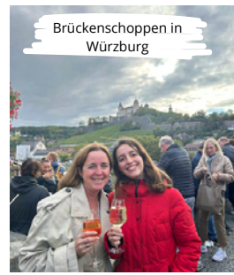
Brückenschoppen in Würzburg

Mit meiner Gastfamilie habe ich viel unternommen: Wasserskifahren, Haaner Kirmes, Phantasialand, Theaterkantine, Haus der Geschichte, Neanderthal Museum, Monet Ausstellung, Schlossburg, ein Fußballspiel im Stadion, Würzburg, Dresden und Düsseldorf, Kürbisse für Halloween schnitzen... Und viel viel mehr.