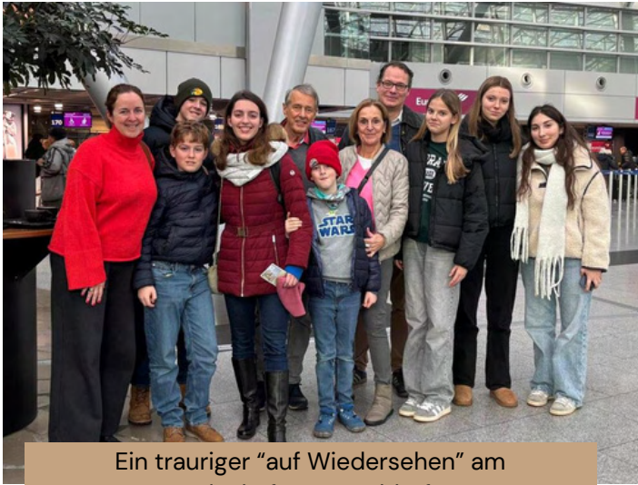
Ein trauriger "auf Wiedersehen" am Flughafen Düsseldorf

Vor einem Jahr konnte ich mir das nicht einmal vorstellen.