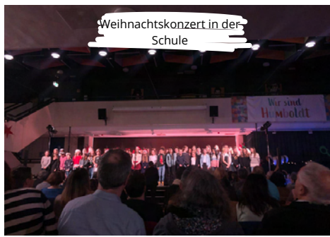
Weihnachtskonzert in der Schule

Ich bin wirklich glücklich über jeden Moment, den ich dort erlebt habe, und ich würde diese Wahl noch tausend Mal treffen. Der schönste Aspekt meiner Erfahrung war die Beziehung zu meiner Gastfamilie und meinen 'Brüdern': ich hoffe, sie bald wiederzusehen, ich vermisse alle. Zum Glück sind Italien und Deutschland nicht allzu weit entfernt.